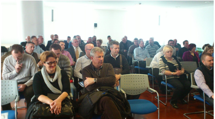
Predstavnici špediterskih kompanija

U obavještenju iz UINO BiH je također navedeno, da nova Naredba o nadležnosti carinskih ispostava neće biti tema na narednom sastanku.