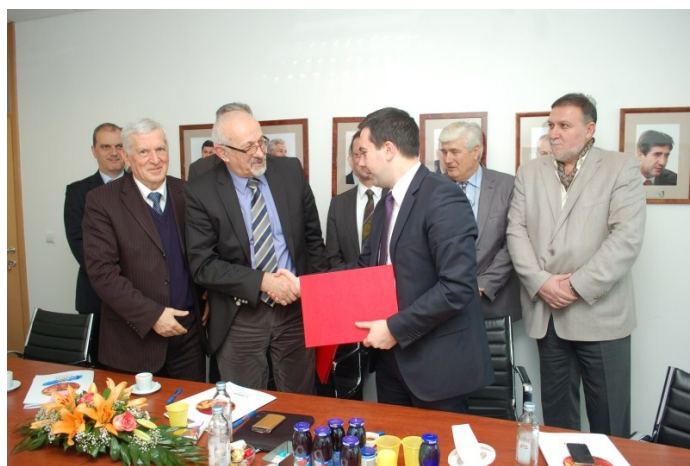
Potpisivanje Memoranduma između APBiH i UBBiH