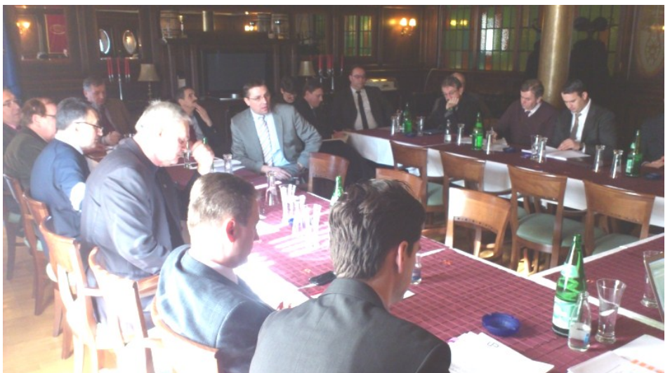
Sjednica je održana u prostorijama kompanije Sarajevska Pivara

Vezano za Strategiju reforme penzijskog sistema u FBiH delegacija će na sjednici ESv-a tražiti da se dostavi Prijedlog Strategije kako bi se poslodavci mogli očitovati. Izvještaj o radu ESV-a je razmotren uz konstataciju da je rad ESV-a odnosno održavanje sjednica, dnevni redovi I donošenje zaključaka na zadovoljavajućem nivou ali Udruženje poslodavaca ističe generalnu primjedbu i nezadovoljno je sa realizacijom zaključaka