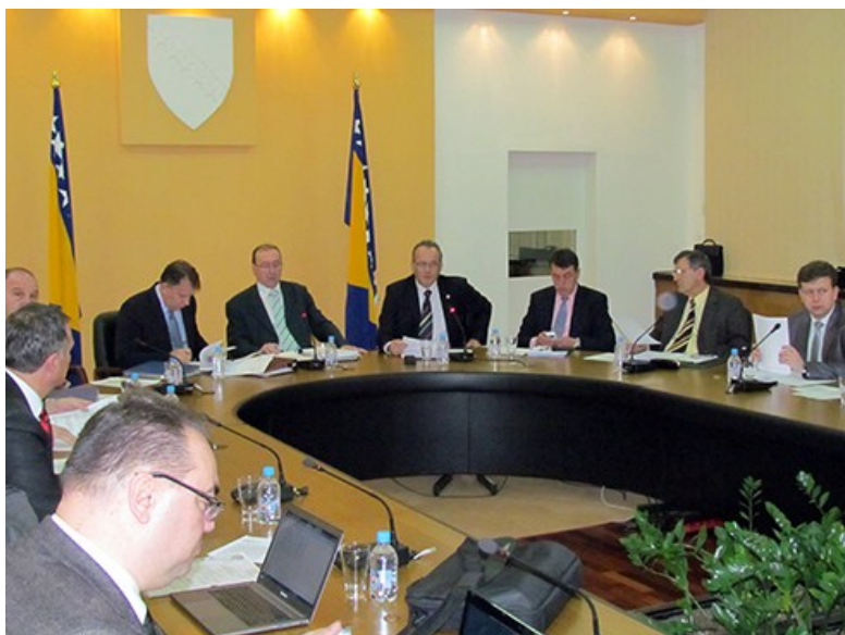
Predstavnicima ESV-a FBiH