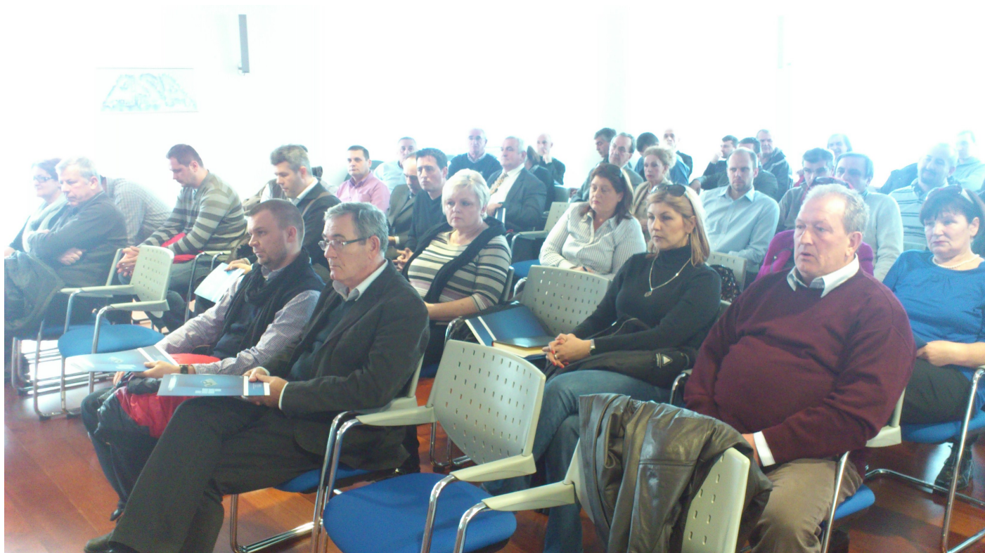
Predstavnici Grupacije poslodavaca špeditera-logističara pri UPFBiH