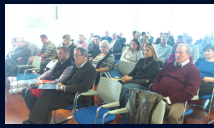
Održan sastanak Grupacije špeditera