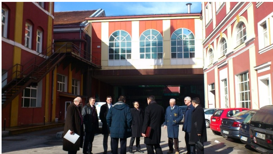
Članovi UO u posjeti Sarajevskoj Pivari

Članovi Upravnog odbora UPFBiH su nakon održane IX proširene sjednice posjetili proizvodni pogon Sarajevske Pivare.