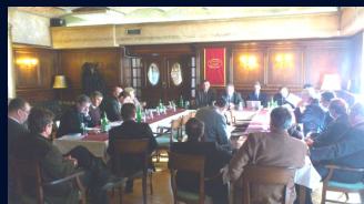
Održana IX proširena sjednica UO UPFBiH

Udruženje banaka BiH i pristupilo Asocijaciji poslodavaca BiH, te je potpisan Memorandum o razumjevanju i saradnji