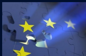
Prvi informativni sastanak o EU