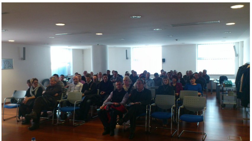
Sastanak je održan u prostorijama ASA– holdinga

Na sastanku je odlučeno da se Grupacija paralelno obrati Vijeću ministara BiH, Ministarstvu vanjske trgovine i ekonomskih odnosa BiH, Parlamentima oba entiteta, ambasadama i njihovim privrednim odjeljenjima, jer je dosta inostranih firmi na čije se poslovanje negativno odražavaju ograničenja implementirana naredbom.