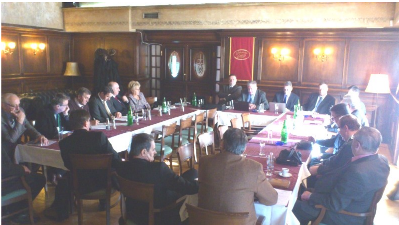
IX proširena sjednica UO UPFBiH