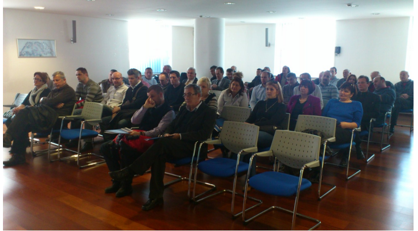
Učesnici sastanka Grupacije poslodavaca špeditera

Pored predstavnika Grupacije i Udruženja poslodavaca FBiH na sastanku je prisustvovao i veliki broj kompanija iz ove oblasti sa prostora cijele Bosne i Hercegovine.