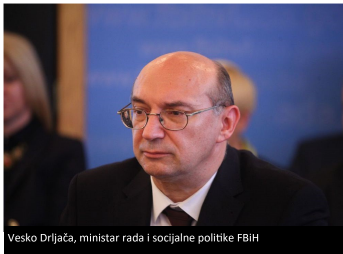
Vesko Drljača, ministar rada i socijalne politike FBiH

propisima o kontroli i registraciji naplate doprinosa, te je predložio da se ovaj zakon dosene po hitnom postupku.