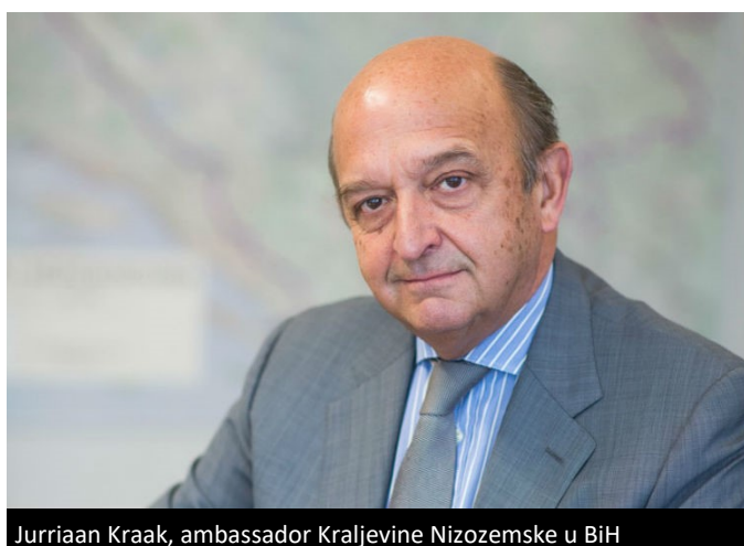
Jurriaan Kraak, ambasador Kraljevine Nizozemske u BiH

"Transformacija socijalnog dijaloga u BiH u učinkovit mehanizam i forum za kolektivno pregovaranje je prijeko potrebna. Preduvjet za uspješnu transformaciju je da svi socijalni partneri, odnosno svi nivoi vlasti u BiH, udruženja poslodavaca i sindikata u BiH, na svim nivoima, pronađu zajedničku viziju socijalnog dijaloga i da rade na ispunjavanju iste", izjavio je Nj.E. Jurriaan Kraak, ambasador Kraljevine Nizozemske u BiH.